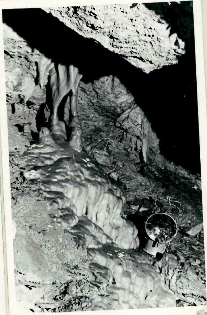
Sinterbildung im Tropfsteingang