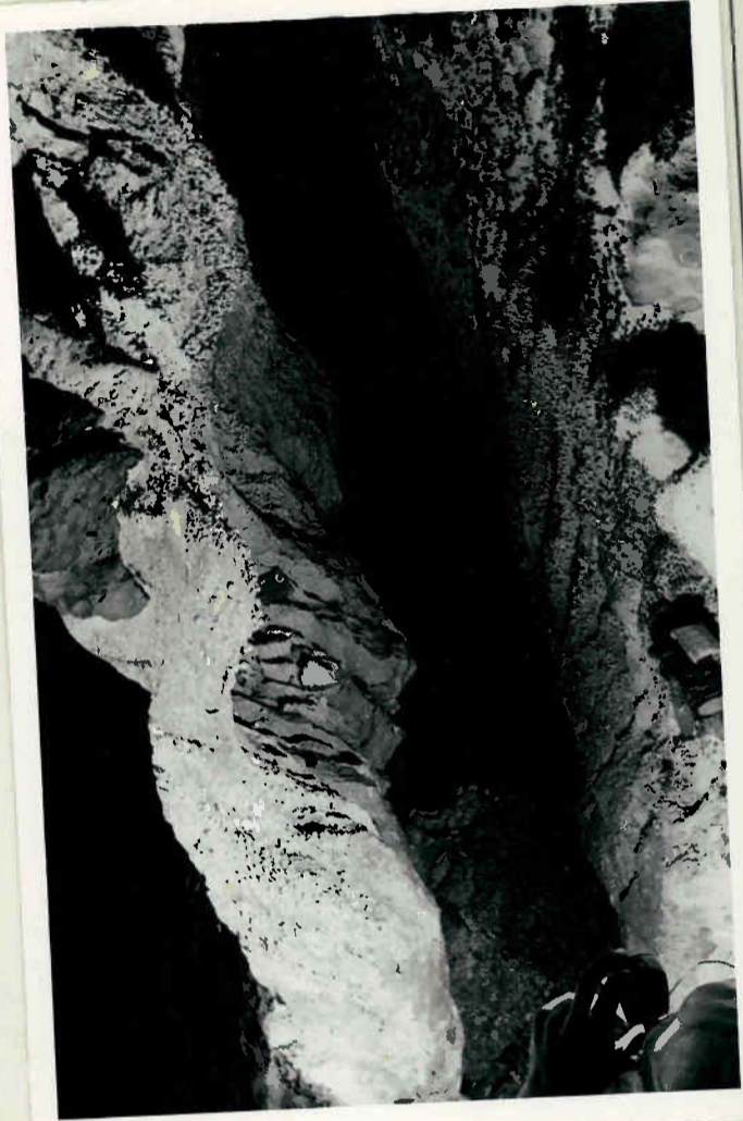
Perlsinter im Endlosen Canon