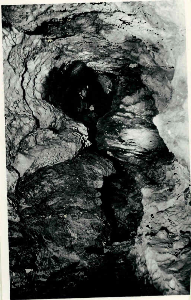
Gangprofile im Nordostgang