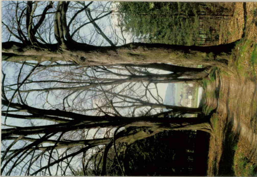
GEGEN WESTEN (LANDSSTR. 8304) U. LANGFELD