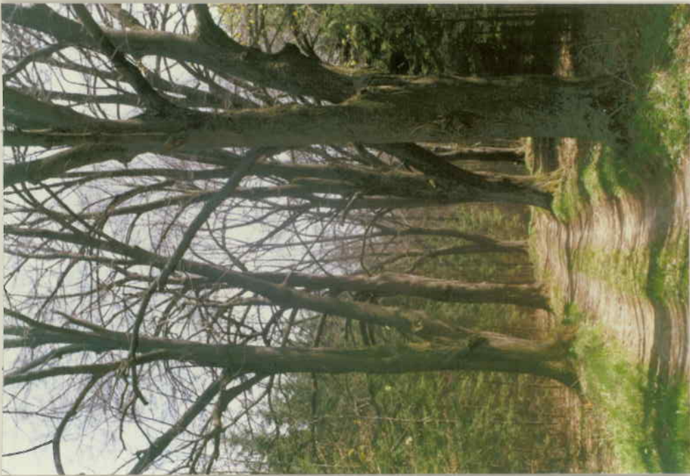
VOM WANDRANGD (LANDSSTR. 8304) NÄCH OSTEN