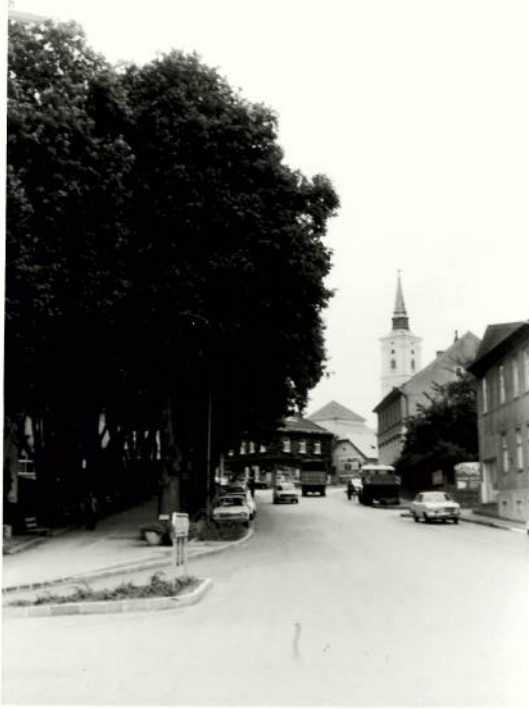
„SCHIMMELPARK“ AUS WESTEN (HEIDENREICHSTEINERSTR.)