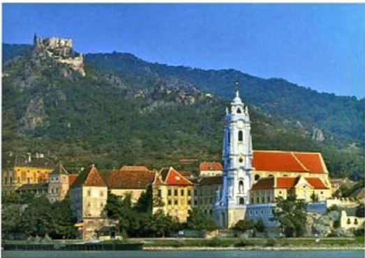
Blick auf das En- semble von Dürnstein