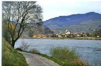
Blick auf Spitz an der Donau

Die ehemals geschlossenen Orte sind durch neue Siedlungen um ein Vielfaches erweitert worden; die neuen Haustypen zeigen vielleicht bei der Dachneigung und Form einen gewissen Bezug zur Kulturlandschaft, die aus dem Villenbau abgeleitete Vorliebe für das Einfamilienhaus stellt jedoch für die Landschaft einen besonders störenden Fremdkörper dar.