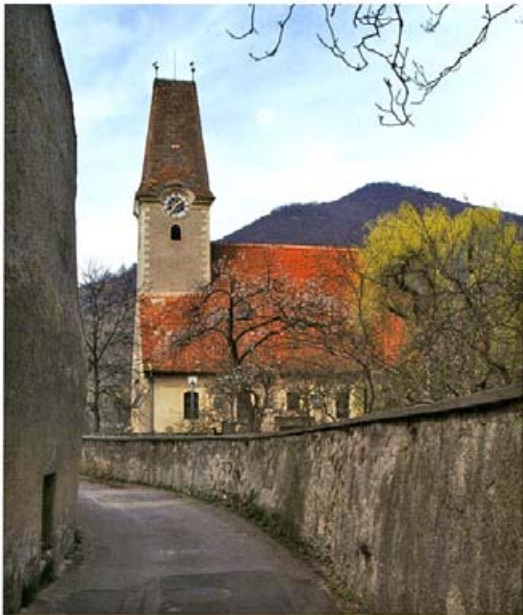
Spitz an der Donau, Schloß Hadres

Wie bereits angedeutet, ist die Wachau jedoch wesentlich mehr als eine großartige romantische Stimmungskulisse. Aus ökologischer, kunstgeschichtlicher und wirtschaftsgeschichtlicher Sicht handelt es sich bei diesem Donautal um eines der bedeutendsten europäischen Beispiele jahrhundertelanger Harmonisierung zahlreicher menschlicher Tätigkeitsfelder auf engstem Raum und damit um ein herausragendes und gewiß hilfreiches Studienmodell im Hinblick auf die Bestrebung des Umweltschutzes und der Umweltgestaltung, deren Aktualität in Hinkunft noch erheblich zunehmen wird.