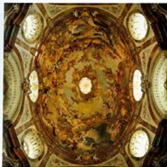
Hauptkuppel der Stiftskirche Altenburg

Seit einigen Jahren wurden an den 1932 – 34 entstandenen Fresken Paul Trogers Farbveränderungen und Wasserschäden festgestellt. Auf Fotos von 1890 und 1911 konnten bereits vergraute Zonen und Rinnspuren bemerkt werden, die sich im Laufe der Jahrzehnte deutlich verstärkt haben. Die Analyse der Klimasituation ergab, daß der Befall von Mikroorganismen an den Fresken in unmittelbarem Zusammenhang mit den Luftfeuchtigkeitsverhältnissen im Kuppelbereich steht. Diese hatten sich durch Reparaturmaßnahmen (um 1919) und der eingebauten Isolierverglasung (1985) an der Laternenkonstruktion verändert. Besonderes Augenmerk war daher der Kondensation und deren Behebung zuzuwenden, wobei man sich nach den absoluten Werten der Außen- und Raumluft zu orientieren hatte und keinesfalls die Abtrocknung der Fundamente forciert werden durfte. Die Kondensation tritt vor allem im Winter auf, dann, wenn die Ober-