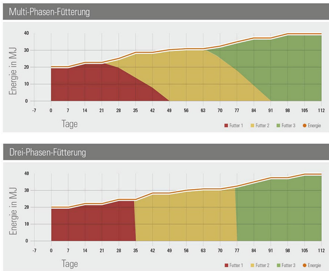
Abbildung 1: Vergleich der Futterzuteilung