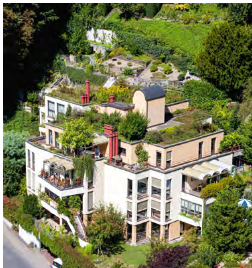
Natürliche Klimaanlage und Regenwassermanager: Vom üppig bepflanzten Dachgarten über die Fassaden- und Innenraumbegrünung bis in die Tiefgaragenbegrünung – Pflanzen auf Gebäuden sind eine effiziente Maßnahme, unsere Lebensräume an die Folgen des Klimawandels anzupassen.

senken. Das würde die Mobilität reduzieren. Vermindern sollen die Pflanzen auch die Betriebskosten für Heizen und Kühlen: Der Energiebedarf soll dank der Pflanzen um 0,19 \text{ W/m}^2 sinken. In diesem Zusammenhang betonte die Geschäftsführerin des Innovationslabors „GrünstattGrau“: „In 20 Jahren werden wir mehr Kühlenergie als Heizenergie brauchen.“ Gebäudebegrünung kann helfen, diesen Energiebedarf niedrig zu halten – und gleichzeitig mehr Lebensqualität bringen. Auch die Tierwelt profitiert von Gebäudebepflanzung: So finden etwa Wildbienenarten in den Pflanzenwelten an Gebäuden einen geeigneten Lebensraum – und diese Tiere sind aufgrund ihrer Bestäubungsaktivitäten enorm wichtig für eine intakte Umwelt. Und inmitten einer intakten Umwelt macht das Leben im „Haus der Zukunft“ wohl erst so richtig Freude. •